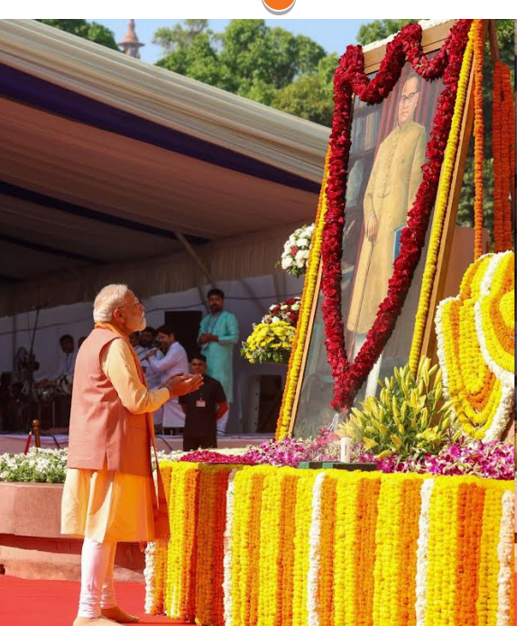
న్యూఢిల్లీ, ఏప్రిల్ 14 : డాక్టర్ భీష్ం రావ్ రాణి అంబేద్కర్ 135వ జయంతి సందర్భంగా ప్రధాని నరేంద్ర మోడీ నివాళులు అర్పించారు.